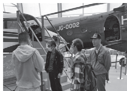
▲所沢航空発祥記念館見学の様子

東武動物公園と雅楽の湯もコースに入っております。家族連れの参加、途中からの合流もあります。日頃、東京に勤務している方で埼玉在住の方も埼玉を知る良い機会と思います。多くの方の参加をお待ちしております。