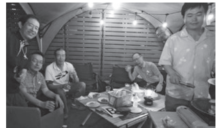
▲「大宮ラクーン」でバルクラシックBBQを楽しみました

以前は埼玉県単独で実施していた「ボウリング&バーベキュー大会」ですが、近隣校友会との共催企画ということで全国の各校友会のなかでもロールモデルの一つとなっています。今後は、もっと人数が増えれば景品のグレードアップや団体戦なども考えており、校友同士のつながりの場として今後も企画していく予定です。