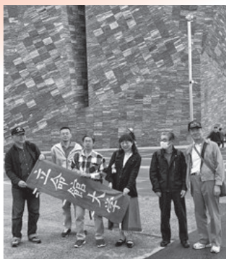
▲角川武蔵野ミュージアム前にて

また、飛行機と戦争との関係は切り離すことはできず、機能向上と戦争の兵器利用との狭間で悩む技術者の葛藤に思いをはせました。